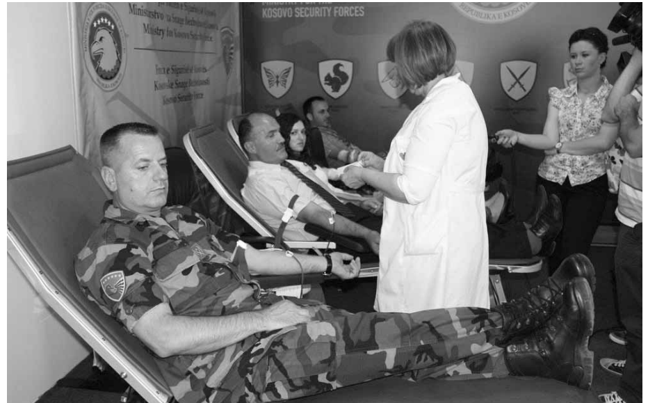
Pjesëtarët e FSK-së donatorë të rregullt të dhurimit të gjakut