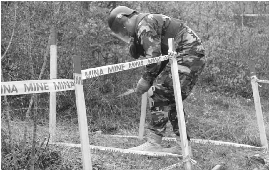
Kompania e Deminimit vazhdon pastrimin e territorit nga mjetet e pashpërthyer